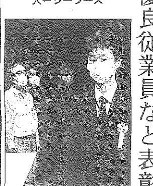
無災害事業場表彰 大シーフーズ

独自の安全衛生活動や働き方改革情報交換会などを通じた働き方改革の推進などについて「これまで以上に安全、安心、健康に働ける職場環境が築かれていくことを願っている」と述べた。 県内の令和3年の労働災害の発生状況については、死傷災害が若干増加したものの