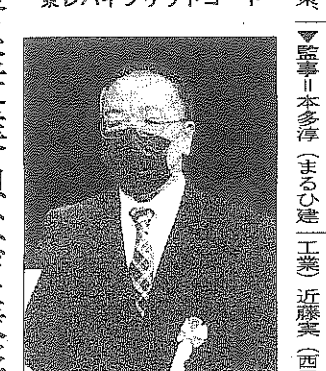
無災害事業場表彰 東レハイブリッドコート

無災害事業場、優良従業員など表彰 無災害事業場表彰 大シーフーズ 優良従業員表彰 伊藤さん(西尾自動車学校)ら 東部分会 ◎木村勝昭